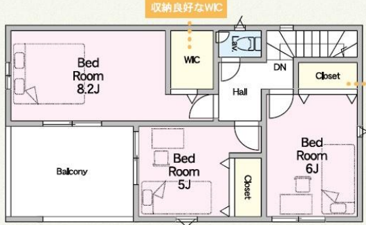
2F 43.74㎡(ルーフバルコニー-9.72㎡)