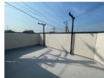
ルーフバルコニー