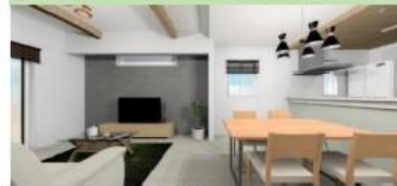
※床材・クロスカラーイメージです。