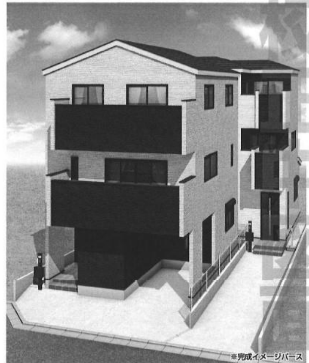
※完成イメージパース