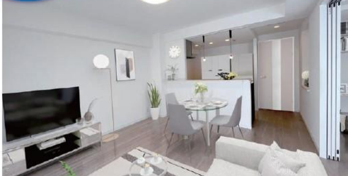
完成イメージパースのため、部屋内の家具や小物類は実際には含まれません。印刷の為、実際の色とは多少異なります。パースと現況が相違する場合は現況を優先いたします。