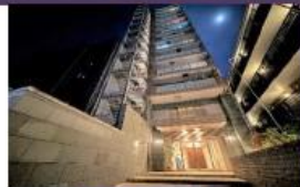
高級感のある外観