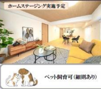
ホームステージング実施予定