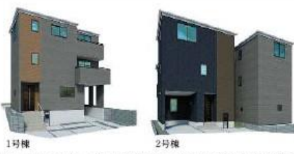
※完成予想図/このパースは図面を基に描いたもので実際とは多少異なる場合がございます。