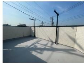
ルーフバルコニー