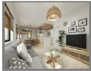
1号棟・内装仕様：Natural/ナチュラル