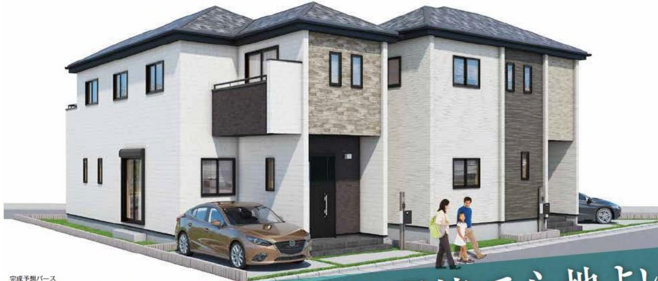
完成予想パース (実際とは多少異なることがあります)