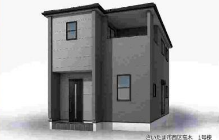
さいたま市西区高木 1号棟

※完成予想図/このパースは図面を基に描いたもので実際とは多少異なる場合がございます。