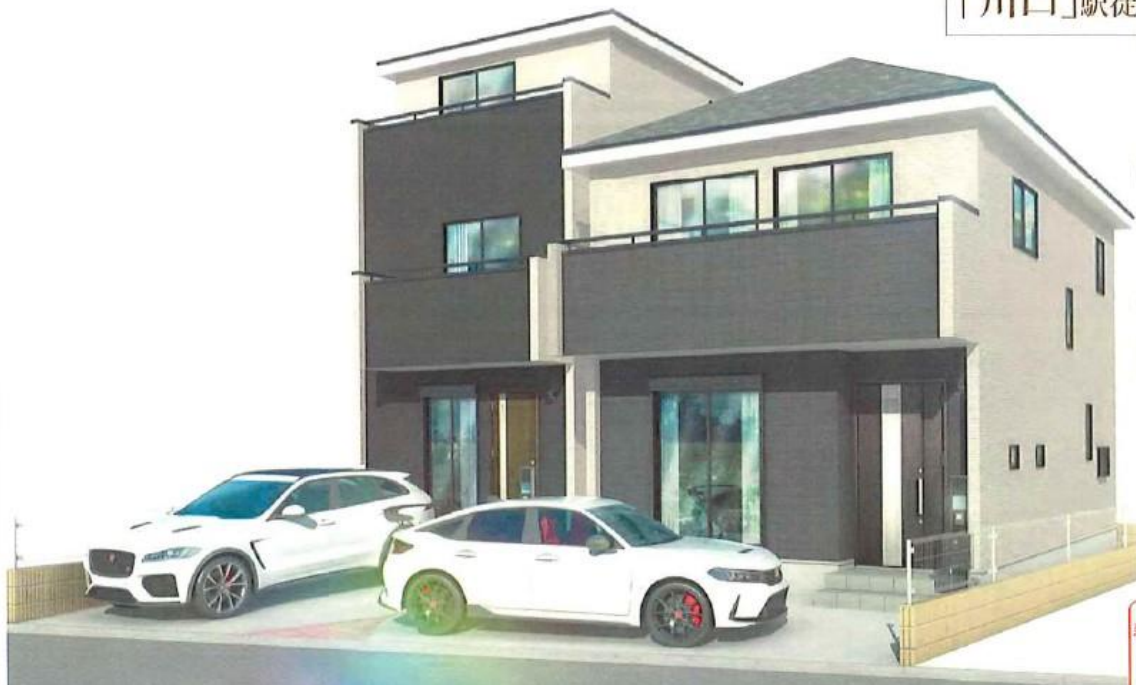
完成予想パース（実際とは多少異なることがあります）