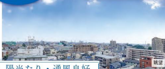
陽当たり・通風良好