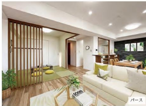
※左記は完成イメージパースになります。 (部屋内の家具は実際には含まれません。)