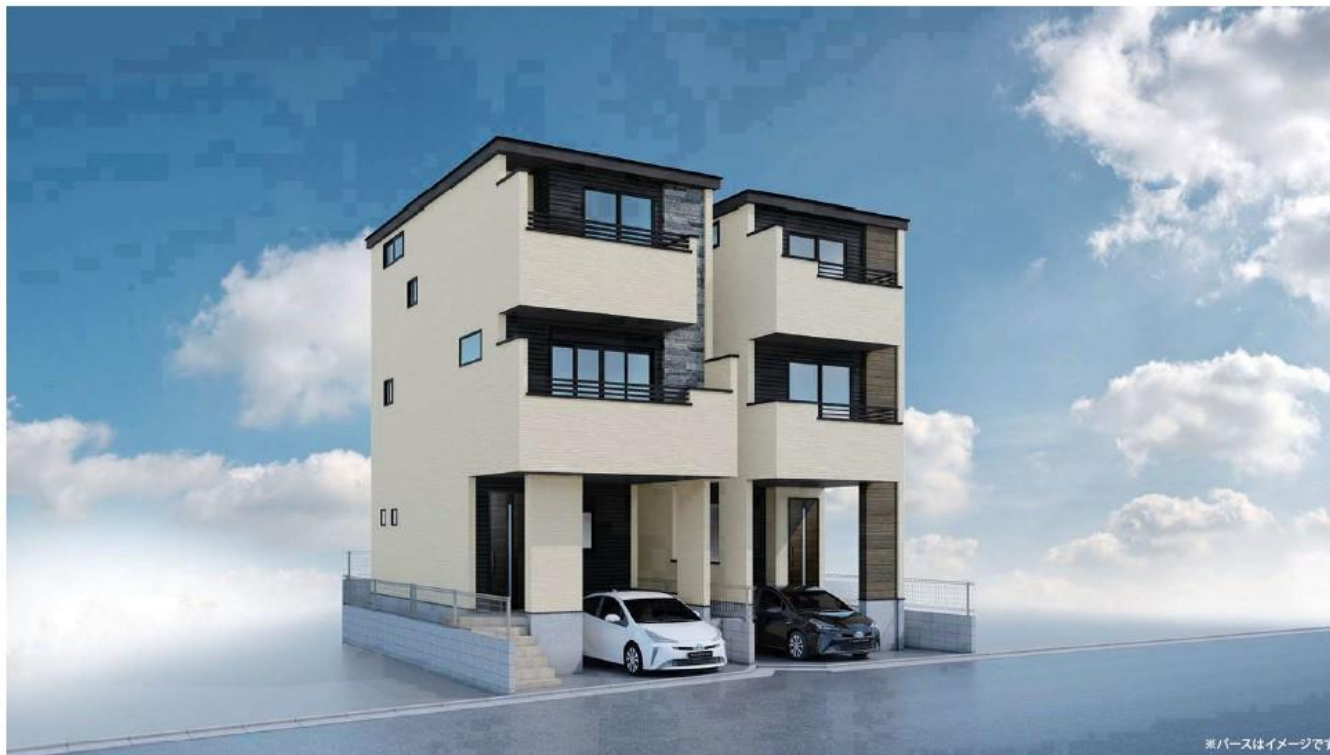
※バスはイメージです