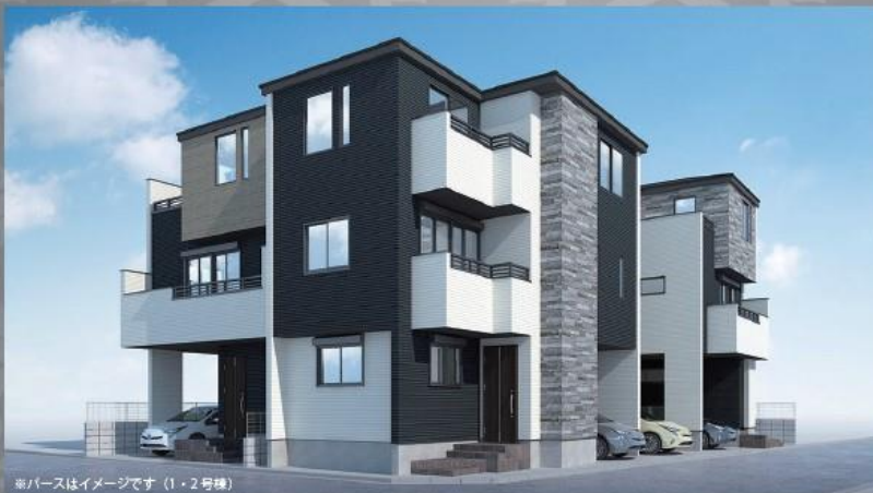
※バスはイメージです (1・2号棟)