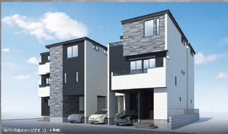
※バスはイメージです (3・4号棟)