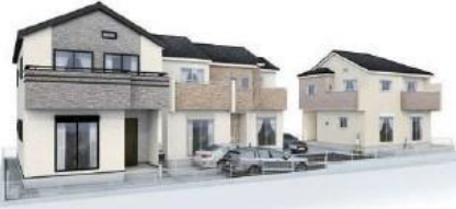
イメージパース※このイラストは図面に基き描きおこしたもので実際とは多少異なります。

駅まで徒歩圏内・バス利用で2路線利用可!都心への好アクセス・利便性にすぐれた立地! 住宅性能評価W取得と税制優遇の長期優良住宅・BELS最高等級の5つ星認定!耐震等級3(最高級)・断熱等性能等級5の永住邸!