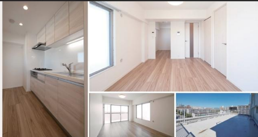
ルーフバルコニーからの眺望(2024年9月撮影)