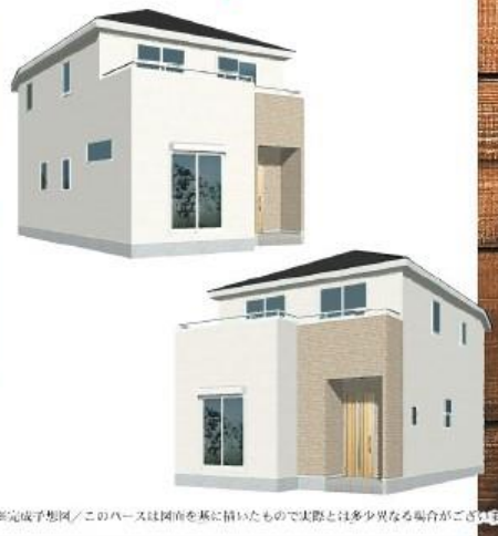
※完成予想図/このハウスは図面を基に描いたもので実際とは多少異なる場合がございます。

物件番号 781E-2ACD | 情報公開日 2024年11月17日 | 広告有効期限 2024年12月02日 | 仲介手数料無料+期間限定キャンペーン実施中!