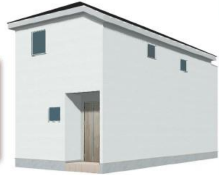
※完成イメージ/このハウスは実物を基にしたもので実際とは多少異なる場合がございます。