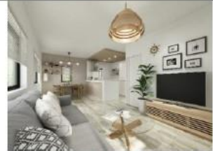
※床材・クロスの内装イメージカラーです

1号棟 4LDK+S(納戸) ■敷地面積 / 70.59 m 2 (約 21.35 坪) ■実測: 約70.88m 2 ■建物面積 / 128.19 m 2 (約 38.77 坪) ■車庫: 約12.42m 2 ■建築確認番号 / ■敷地: KBI-YKH23-10-3927 号 ( 令和5年12月21日 ) 販売価格 5,448 (税込) 万円