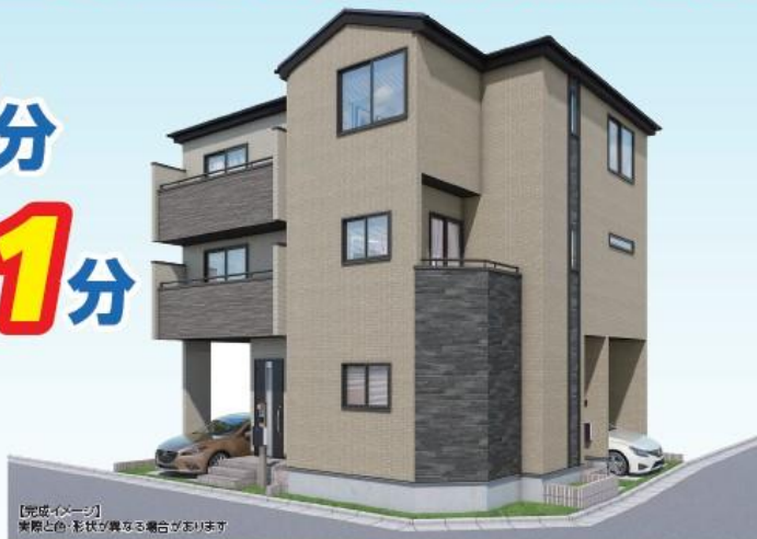
【完成イメージ】 実際とは、形状が異なる場合がございます