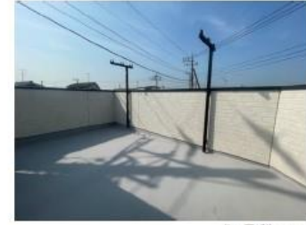
ルーフバルコニー