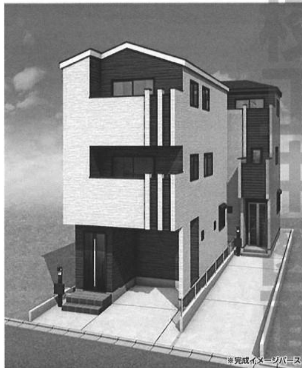
※完成イメージパース