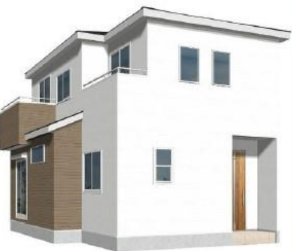
※完成予想図/このパースは前面を基に描いたもので実際とは多少異なる場合がございます。

〔物件概要〕所在地/埼玉県さいたま市岩槻区大字平林寺字東713-3(地番)、埼玉県さいたま市岩槻区大字平林寺713-3(住居表示)口土地権利/所有権口地目/宅地口総棟数/1棟口販売棟数/1棟口建物構造/木造在来軸組工法2階建(900モジュール)都市計画/市街化調整区域用途地域/無指定口建ぺい率/60%口容積率/200%口設備/東京電力・都市ガス・私営水道・下水口接続状況/南東側4m公道口現況/造成中口完成/2024年8月中旬引渡日/2024年9月中旬引渡日/※広告の取扱いに関しては法令遵守にてお願いします。※競戸・照明・溝・カーテンレール・防水パン・カーポートはオプションとなります。※宅地内に電柱及び電線が入る場合があります。※司法書士は、当社指定になります。※図面と現況に相違がある場合は現況優先とします。広告有効期限/2024年5月31日