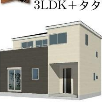
※完成予想図/このパースは図面を基に描いたもので実際とは多少異なる場合がございます。