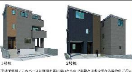
※完成予想図/このパースは図面を基に描いたもので実際とは多少異なる場合がございます。

1F: 40.81㎡ 車庫: 14.89㎡ 2F: 37.26㎡ 3F: 37.26㎡