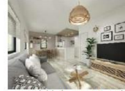
※床材・クロスの内装イメージカラーです