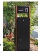
宅配BOX付システム門柱→