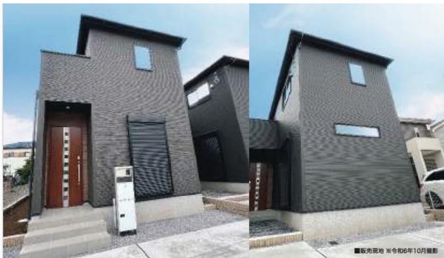
■販売現地 ※令和6年10月撮影