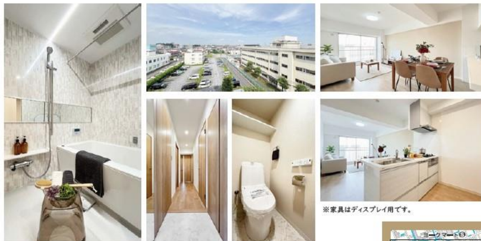
※家具はディスプレイ用です。