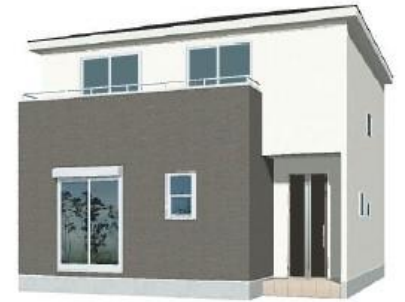
※完成予想図/このハウスは団地を基に描いたもので実際とは多少異なる場合がございます。

〔物件概要〕所在地/〔地番〕埼玉県さいたま市大宮区三橋4-71-4、(住居表示)埼玉県さいたま市大宮区三橋4丁目71番4口土地権利/所有権口地目/宅地口総棟数/1棟口販売棟数/1棟口建物構造/木造在来軸組工法2階建(910モジュール)口都市計画/市街化区域口用途地域/第2種中高層住居専用地域口建ぺい率/60%口容積率/200%口設備/東京電力・都市ガス・公営水道・下水道口接道状況/南西側4m私道口現況/古屋あり口完成/2024年12月下旬予定口引渡日/2025年1月下旬予定口備考/※広告の取扱いに関しては法令遵守にてお願いします。※網戸・照明・溝緑・カーテンレール・防水バルコニー・カーポートはオプションとなります。※宅地内に電柱及び支線が入る場合があります。※司法書士は、当社指定になります。※図面と現況に相違がある場合は現況優先とします。※全棟が長期優良住宅対象物件です。広告有効期限/2024年9月30日