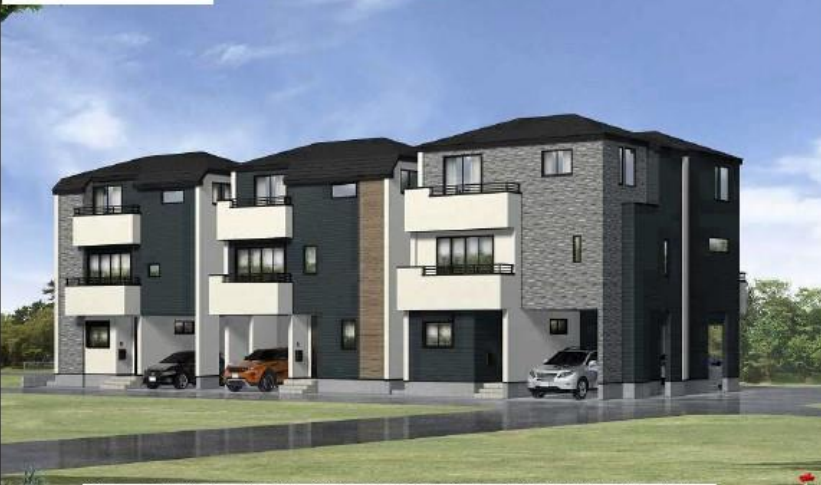
※パースはイメージです。現況と異なる場合は、現況を優先いたします。