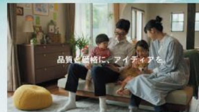
品質と価格に、アイディアを