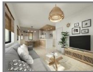
1号棟・内装仕様：Natural/ナチュラル