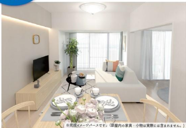
※完成イメージベースです。(部屋内の家具・小物は実際には含まれません。)

／JR 埼京線『北戸田』駅 まで徒歩 13 分 / JR 京浜東北線・JR 武蔵野線『南浦和』駅 まで徒歩 19 分