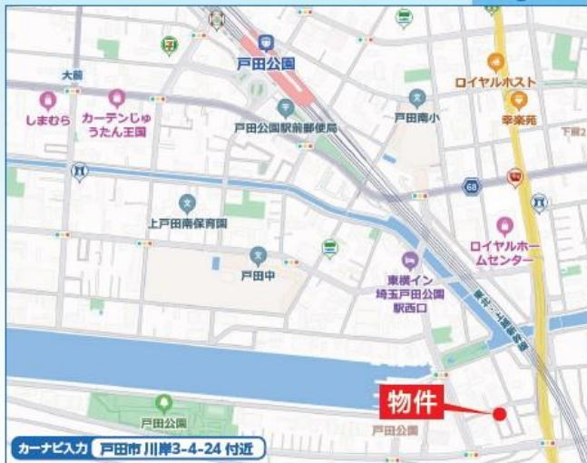
カーナビ入力 戸田市川岸3-4-24 付近