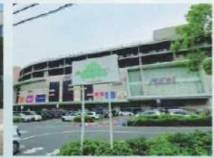
イオンモール北戸田店

物件番号 2BAA-35E1 情報公開日 2024年09月10日 広告有効期限 2024年09月25日 仲介手数料無料+期間限定キャンペーン実施中!