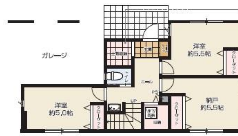
1F / 58.22㎡ (約17.61坪)

洋服だけじゃなく、扇風機やストーブ、加湿器など季節物の大きな家電も収納できます。