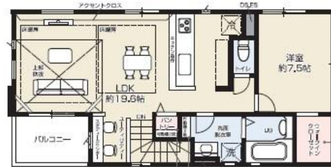
2F / 57.23㎡ (約17.31坪)

1号棟 敷地面積 / 89.66㎡ (約27.12坪) 建築確認番号 / 第SJK-KX235507910号 建物面積 / 115.45㎡ (約34.92坪) 接道 / 西側約4.1m 公道 ※建築面積に車庫部分 (14.53㎡) 含む