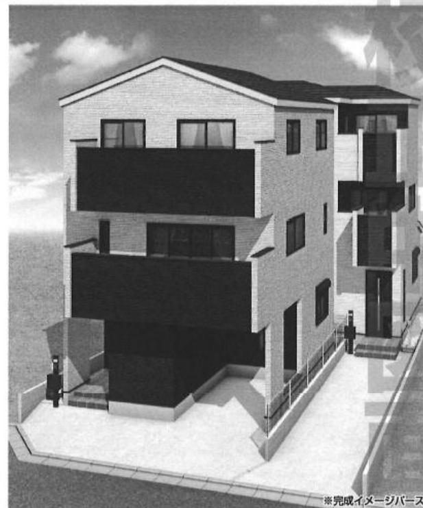
※完成イメージバス