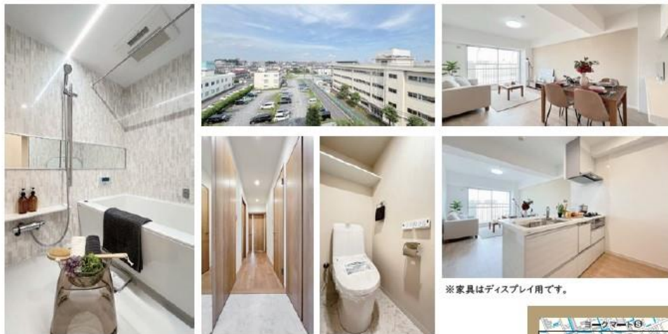
※家具はディスプレイ用です。