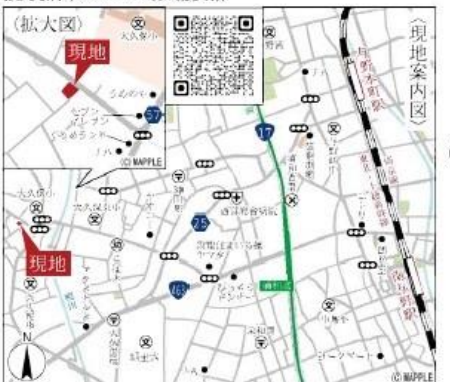
Car navigation さいたま市桜区五関851付近

Life information 大久保小学校 .....410m(徒歩6分) 大久保保育園 .....701m(徒歩9分) 大久保中学校 .....549m(徒歩7分) おおとり幼稚園 .....741m(徒歩10分) センティア(はらけ)学苑 .....138m(徒歩2分) 八田公園 .....968m(徒歩13分) セブンスこどもクリニック .....163m(徒歩3分) 業務スーパー 南与野店 .....1.9km(徒歩24分) さいたま市南区大久保支所 .....216m(徒歩3分) おぎし菜園 .....480m(徒歩8分)